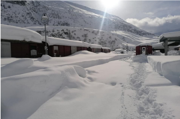
Realp im Schnee (26.01.2021)